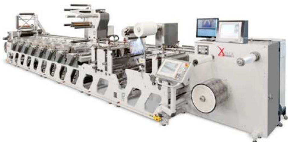
Obr. 1 OMET XFlex X5 flexografický tiskový stroj

Pohony KOLLMORGEN patří mezi špičkové produkty, které využívají výrobci strojů, jímž jde především o maximální dynamiku, přesnost a životnost. Mezi typické zákazníky patří výrobci zabývající se TISKem, BALENím a NAVÍJENím. Inovativní řešení pomocí decentralizovaných driverů AKD-N, momentových motorů Direct Drive DDR a bezpečnostních modulů KSM patří mezi technicky nejspolehlivější řešení na trhu.